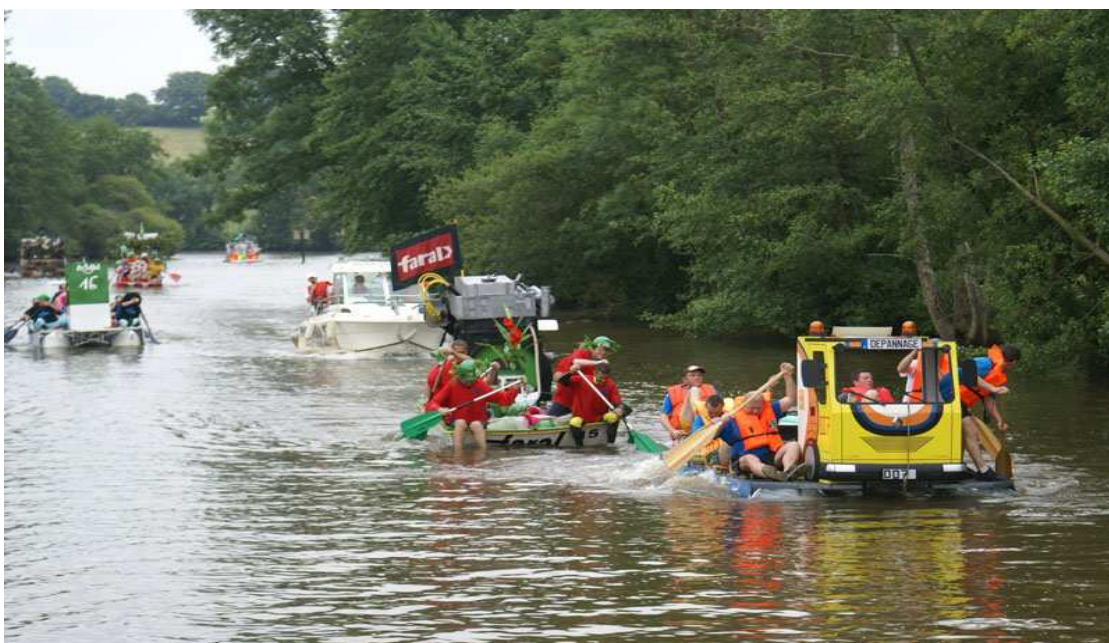
Photo d'une édition OFNI (Objets Flottants Non Identifiés) menée par la Jeune Chambre Economique de Laval